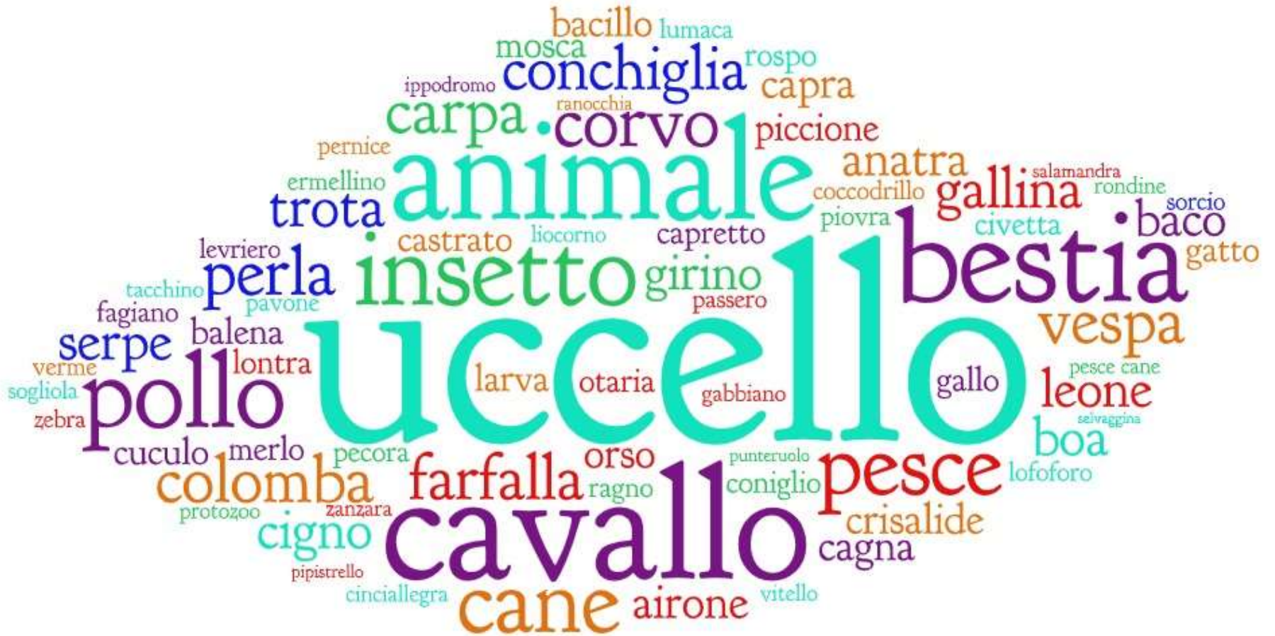
La strada di Swann