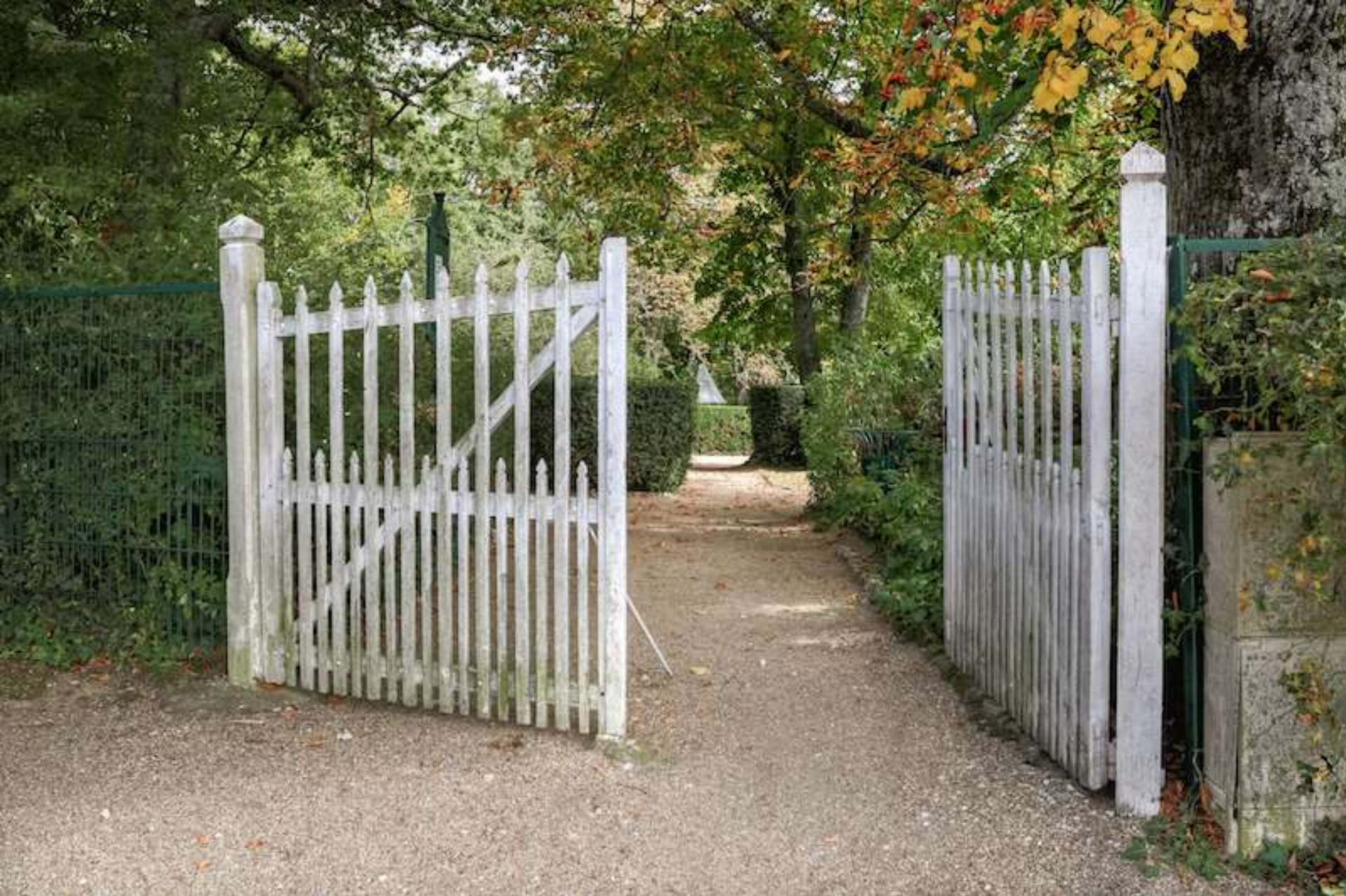
The gate to “Charles Swann’s Garden” at Illiers-Combray.