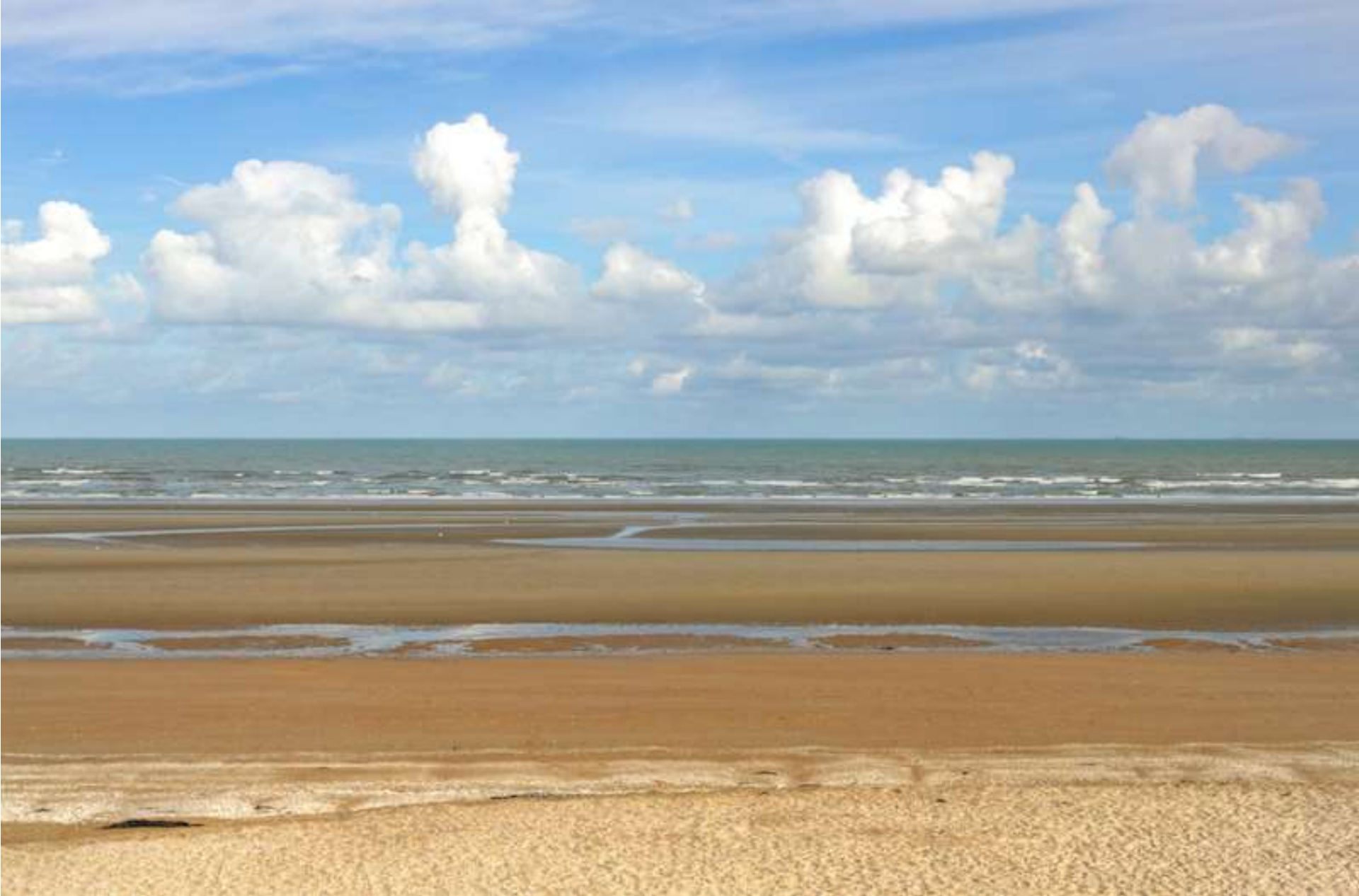
The beach in front of the Grand-Hôtel in Cabourg.